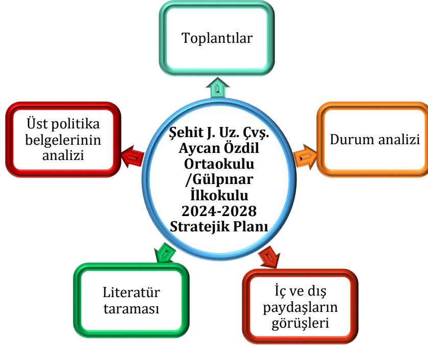
Şekil 1: Stratejik Plan Oluşum Şeması

Okulumuzun 2024-2028 stratejik planın hazırlanmasında tüm tarafların görüş ve önerileri ile eğitim önceliklerinin plana yansıtılabilmesi için geniş katılım sağlayacak bir model benimsenmiştir. Bu amaca ulaşabilmek için farklı fikirlerin plan metninde yer almasına ve değerlendirilmesine özen gösterilmeye çalışılmıştır. Stratejik plan temel yapısı Müdürlüğümüz Stratejik Planlama Üst Kurulu tarafından kabul edilen Müdürlük Vizyonu ulaşabilmek amacıyla eğitimin üç temel bölümü (erişim, kalite, kapasite) ile paydaşların görüş ve önerilerini baz alır nitelikte oluşturulmuştur.